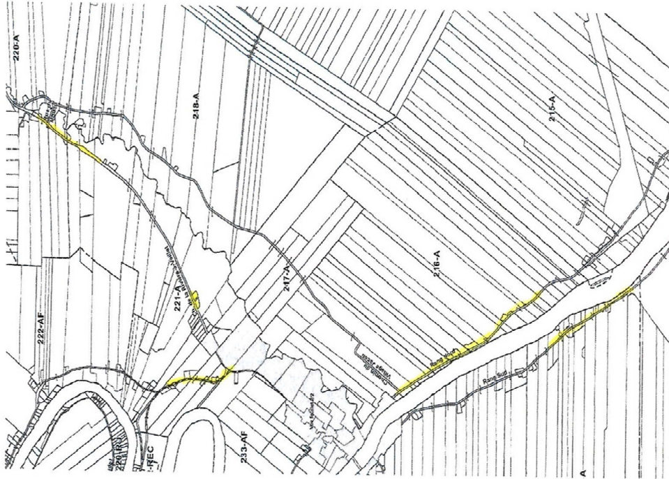
Partie du rang Rivière-à-Veillet – partie du rang des Forges – partie du rang Nord et partie du rang Sud