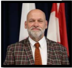
Message de la direction générale