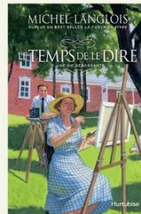
Tome 5/Michel Langlois